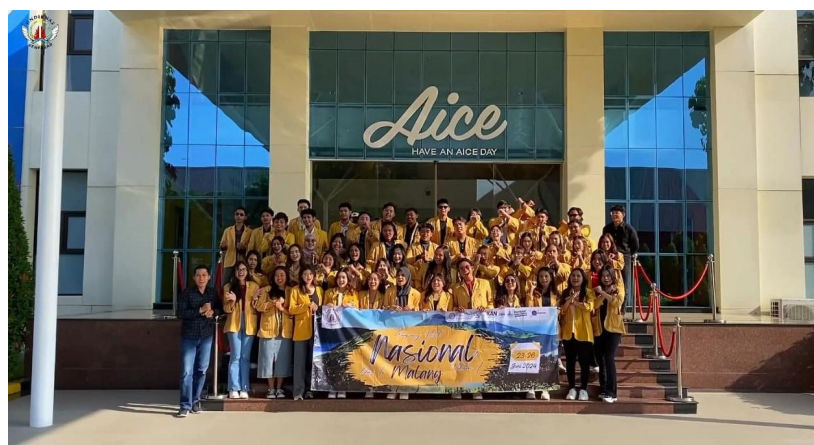
Gambar 1 Kunjungan perusahaan PT Aice Mahasiswa UNDIKNAS