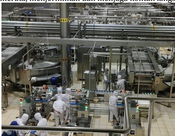
Gambar 3 Alat Pembuatan Es Krim Aice