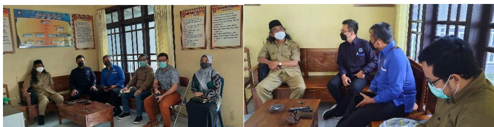
Gambar 1. Diskusi bersama pemangku kebijakan Desa Campuranom

Sebelum melakukan pemetaan terhadap potensi pemanfaatan limbah feses atau kotoran ternak menjadi biogas di wilayah Desa Campuranom, dilakukan diskusi terlebih dahulu dengan pemangku kebijakan dan juga dengan para pelaku yang bergerak di sektor peternakan. Diskusi dengan pemangku kebijakan terkait dengan perijinan dan sinergi atau upaya penyesuaian dengan rencana arah pengembangan Desa Campuranom. Hasilnya: (a) Terdapat pemahaman yang sama tentang upaya perlindungan terhadap lingkungan; (b) Pengembangan teknologi energi terbarukan dengan konsep desa mandiri energi yang ditawarkan tim pengabdian disepakati, dan nantinya dijadikan dasar untuk pengembangan desa wisata energi; (c) Pemangku kebijakan sepakat untuk terlibat langsung baik dalam hal legalitas (berupa kebijakan pendukung), sosialisasi kepada masyarakat, dan juga keterlibatan dalam hal pendanaan.